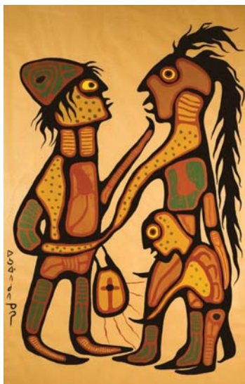
Норваль Моррисо. “Дар”. 1975 г.

советовавшему записывать легенды племени оджибвеев, впоследствии изданные при его поддержке.