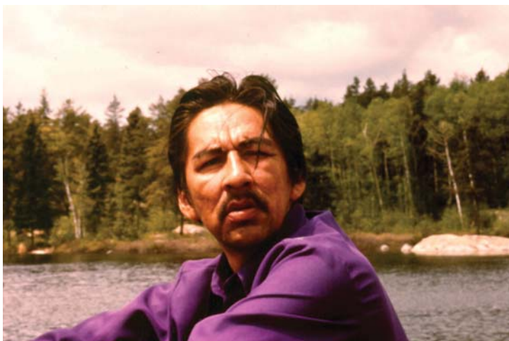
Норваль Моррисо. Кадр из фильма “Парадокс Норваля Моррисо”. 1974 г.

В развитии молодого художника большая роль принадлежит врачу Джозефу Вайнштейну, который в молодости учился живописи в Париже и познакомил Норваля с достижениями европейского модернизма, а также антропологу Селвину Дьюдни, не только поощрявшему занятия живописью Норваля и нанявшему его в качестве гребца в поисках древних наскальных изображений, но и настойчиво