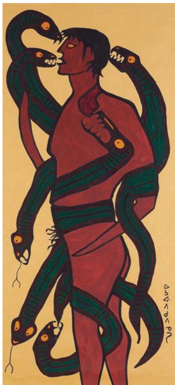
Норваль Моррисо. “Авто-портрет пожираемого демонами”. 1964 г.