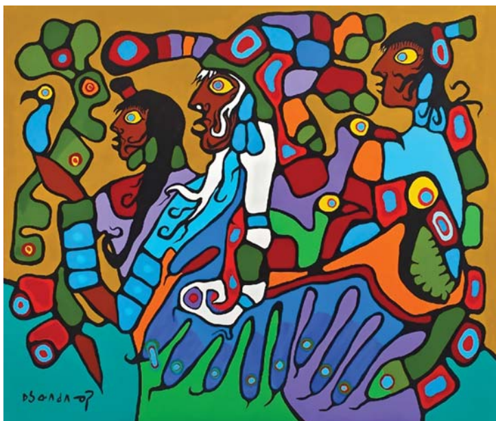
Норваль Моррисо. “Шаман и его ученики”. 1979 г.

В 1995 г. Ассамблея первых наций пожаловала Моррисо свою высшую награду — орлиное перо. В том же году у него была диагностирована болезнь Паркинсона. По мере ее прогрессирования физическое состояние художника ухудшалось. Не отказываясь от назначенного лечения, он