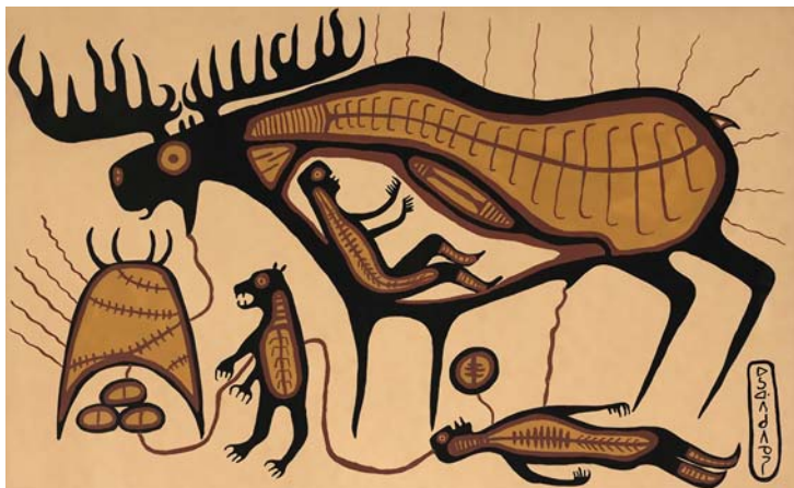
Норваль Моррисо. “Лосиная мечта Люка Онанаконгоса”. Около 1964 г.

В начале 1970-х годов художник сильно обгорел во время пожара. Большую часть