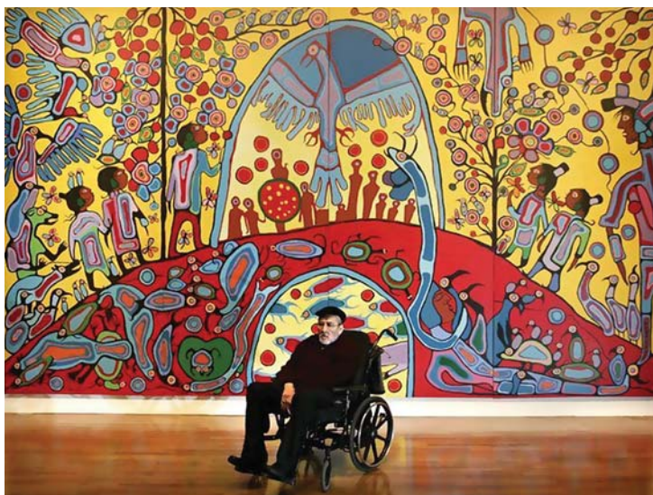
Норваль Морриссо перед своей картиной “Андрогины” (1979) на последней прижизненной выставке в Национальной галерее Канады. 2006 г.

“Мои руки не дрожат, когда я держу кисть”, — сказал Норваль в 1999 г. Но в начале 2000-х годов по настоянию арт-дилера художник написал открытое письмо о том, что состояние здоровья не позволяет ему творить и он просит все новые его работы, появляющиеся на рынке, считать подделками.