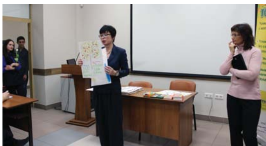
Анализ работы слушателей согласно принципам цветотерапии.